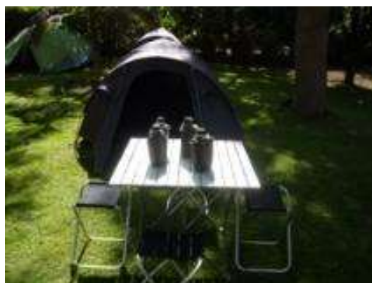
Tente client et table à manger